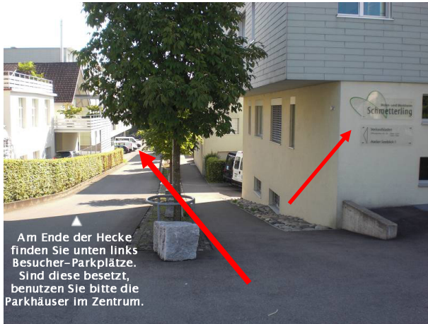
Vor dem Wohnheim Schmetterling, links runter Parkplätze sind auf der Rückseite des Gebäudes