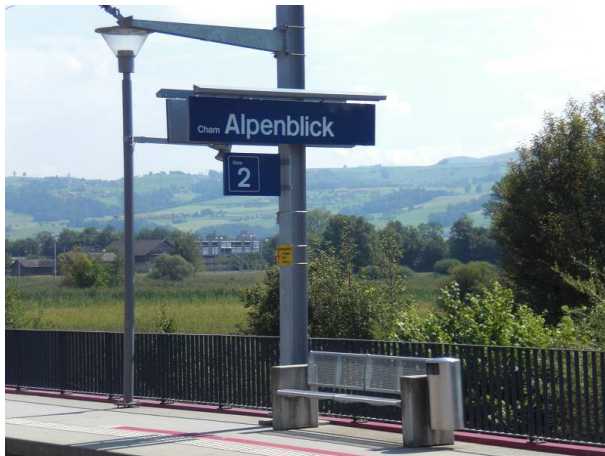
S-Bahn-Haltestelle: Cham Alpenblick