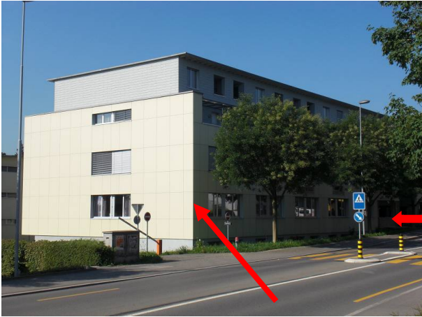
Von Zug her kommend, linke Strassenseite