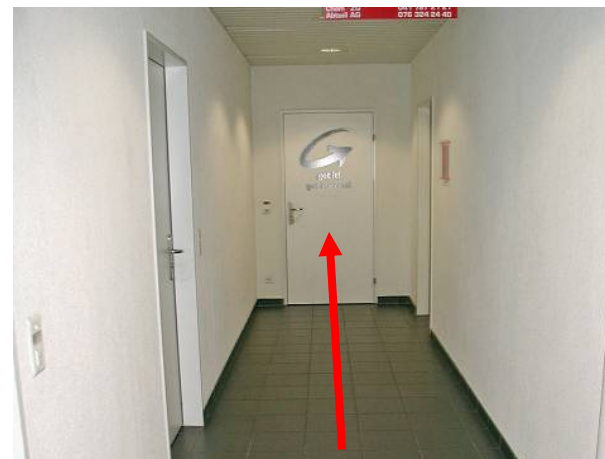
Am Ende des Ganges finden Sie get it!