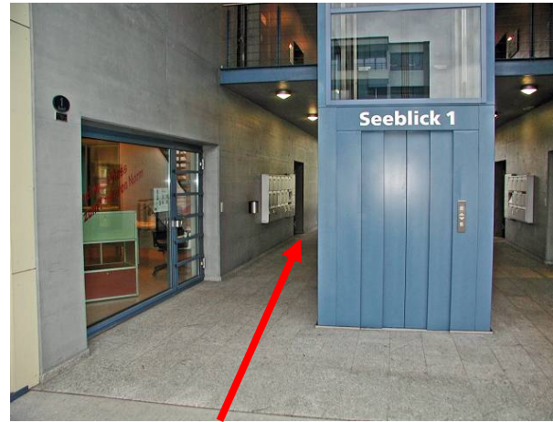
Eingang in der Mitte des Gebäudes (Passage)