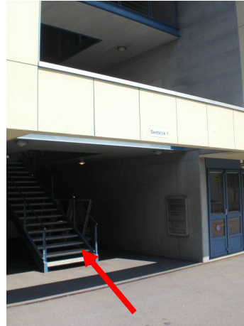
Aufgang von den Parkplätzen hinter dem Gebäude